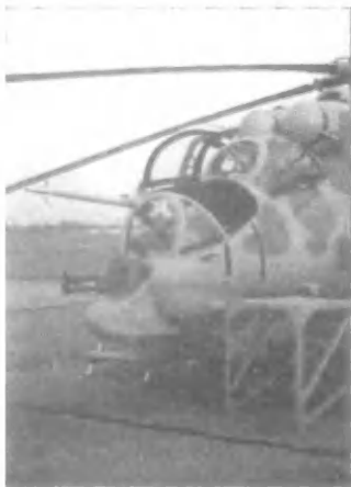
Прицельный комплекс «Зарево».

низации некондиционных или изготовленных сомнительными "фирмами" жизненно важных агрегатов, узлов и оборудования, даже косвенно влияющих на жизненный цикл летательного аппарата. Лишь когда это будет сделано, можно указывать пальцем на промышленность, и то если доказать, что летный и диспетчерский составы к летным происшествиям не причастны.